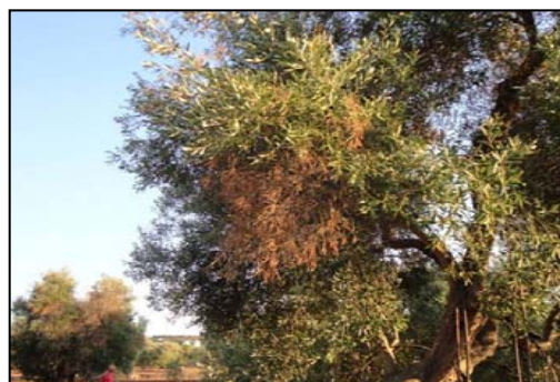
X. fastidiosa në dru ulliri