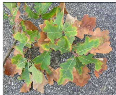
X. fastidiosa në gjethet e lisit.