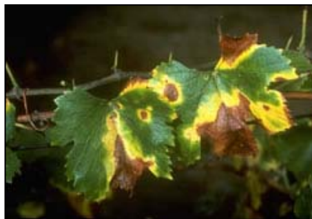
X. fastidiosa në gjethet e rrushit të verës.