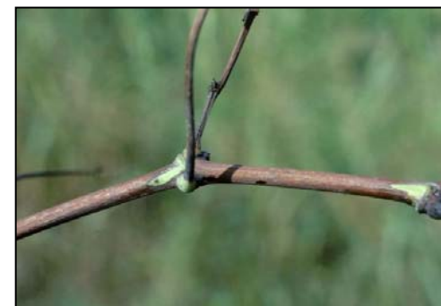
"Ishull i gjelbër" simptomë në degën e rrushit.